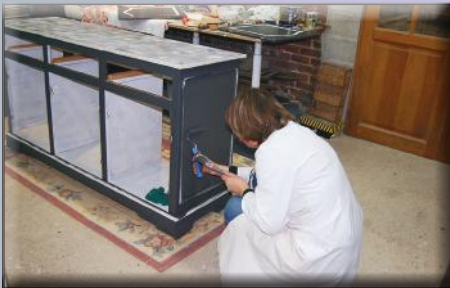
Rénovation de meubles - Magasin Lillers