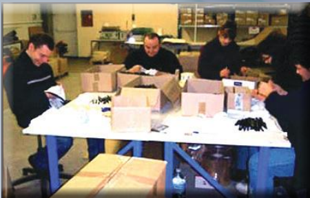
Travaux de conditionnement - Atelier Auchel