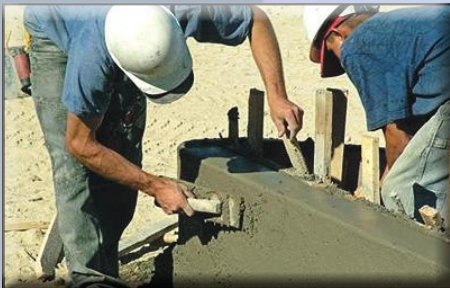
Bâtiment - Chantier Lillers

L'A.C.I. offre un contrat de travail de 6 à 24 mois. L'objectif est de transmettre le savoir être et un savoir faire afin que ces personnes puissent renouer avec le marché du travail.